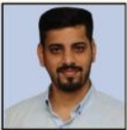
PRAJWAL SIR SOCIETY