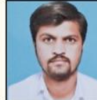
MAMDAPUR SIR PHYSICS