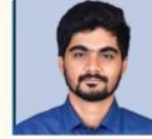
NANDAN SIR ENVIRONMENT & CA