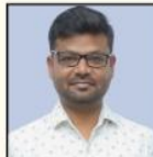
LINGARAJU SIR ESSAY