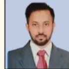
NAVEEN SIR HISTORY