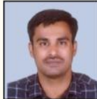
VINAYAK SIR HISTORY