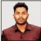
SRIKANTH SIR SCIENCE & TECHNOLOGY