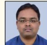
YOGANAND SIR AGRICULTURE