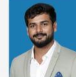
SANJAY SIR COMPUTER