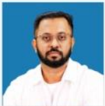
NAVEEN SIR MODERN & KARNATAKA HISTORY