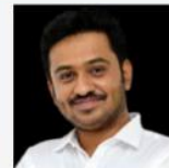
DHRUVA SIR WORLD INDIAN & KARNATAKA GEOGRAPHY