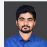
NANDAN SIR ENVIRONMENT & CA