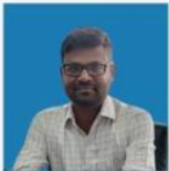
LINGARAJU SIR ESSAY, PRECIS & TRANSLATION