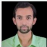
SHASHANK SIR WORLD & INDIAN, KARNATAKA GEOGRAPHY