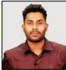
SRIKANTH SIR SCIENCE & TECHNOLOGY