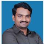
NINGAPPA MENTAL ABILITY