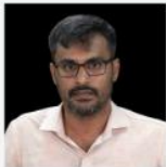
VINAYAK SIR ANCIENT & MEDIEVAL