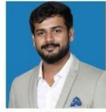
SANJAY SIR COMPUTER