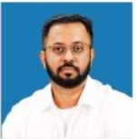
NAVEEN SIR MODERN & KARNATAKA HISTORY