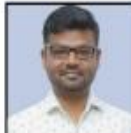
LINGARAJU SIR ESSAY