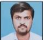
MANDAPUR SIR PHYSICS