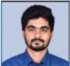
NANDAN SIR ENVIRONMENT & CA