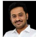
DHRUVA SIR WORLD INDIAN & KARNATAKA GEOGRAPHY