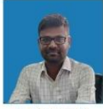
LINGARAJU SIR ESSAY, PRECIS & TRANSLATION