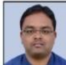
YOGANAND SIR AGRICULTURE