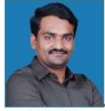
NINGAPPA MENTAL ABILITY