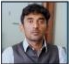
GIRIDHAR SIR ETHICS