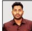
SRIKANTH SIR SCIENCE & TECHNOLOGY