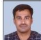
VINAYAK SIR HISTORY