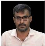
VINAYAK SIR ANCIENT & MEDIEVAL