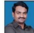
NINGAPPA SIR MENTAL ABILITY