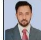
NAVEEN SIR HISTORY