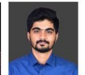
NANDAN SIR ENVIRONMENT & CA