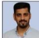
PRAJWAL SIR SOCIETY