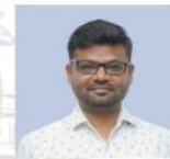
ಲಿಂಗರಾಜು ಸರ್ ಪ್ರಬಂಧ, ಸಂಕ್ಷಿಪ್ತ ಬರವಣಿಗೆ ಮತ್ತು ಅನುವಾದ