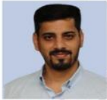
ಪ್ರಜ್ವಲ್ ಸರ್ ಸಮಾಜ