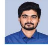
ನಂದನ್ ಸರ್ ಪರಿಸರ ಅಧ್ಯಯನ ಮತ್ತು ಪ್ರಕೃತಿ ವಿದ್ಯಮಾನ