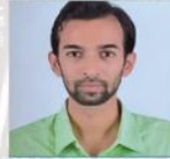
ಶಶಾಂಕ್ ಸರ್ ಭೂಗೋಳ ಶಾಸ್ತ್ರ