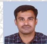
ವಿನಾಯಕ್ ಸರ್ ಇತಿಹಾಸ