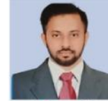
ನವೀನ್ ಸರ್ ಇತಿಹಾಸ