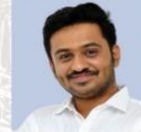
ಧ್ರುವ ಸರ್ ಭೂಗೋಳ ಶಾಸ್ತ್ರ