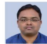
ಯೋಗಾನಂದ ಸರ್ ಕೃಷಿ